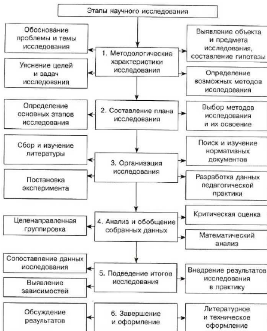
Рисунок 1 - Составляющие этапов научного исследования

В первом семестре наиболее целесообразной является практическая реализация следующих этапов и видов выполнения и контроля НИР магистрантов: